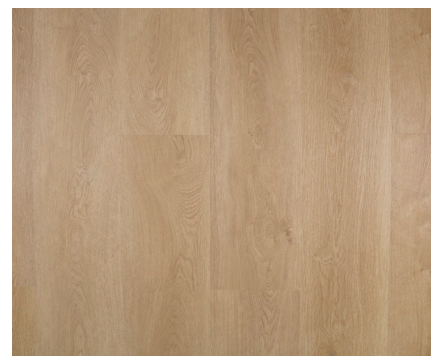
Brighton Varenr.: 155074 DB nr.: 2266374