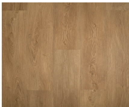
Birmingham Varenr.: 155073 DB nr.: 2266373