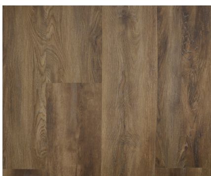
Sherwood Varenr.: 155075 DB nr.: 2266375