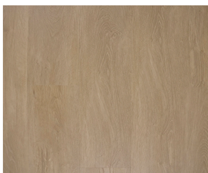
Oxford Varenr.: 155076 DB nr.: 2266376